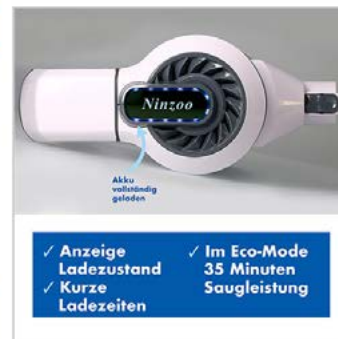
Tech. Funktion: 1 Foto