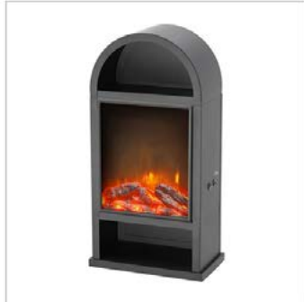
Hauptbild: 1 Foto