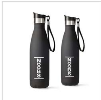
Hauptbild: 1 Foto mit Schatten, dupliziert