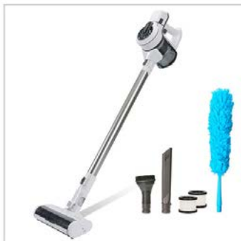
Hauptbild plus Lieferumfang: 5 Fotos