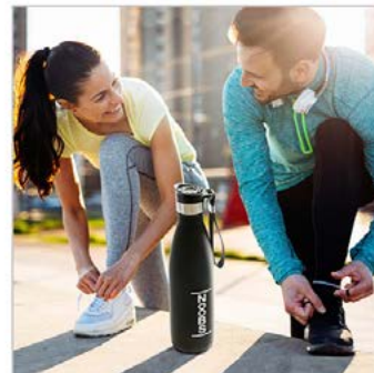
Lifestyle: 1 Foto, Bildbearbeitung Produktfoto + Stockfoto

ca. 76,00 € ohne Text, ca. 82,00 € mit Text