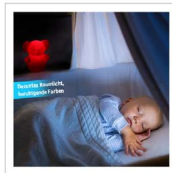
Anwendung: 1 Foto, Bildbearbeitung Produktfoto + Stockfoto

ca. 188,00 € ohne Text, ca. 222,00 € mit Text