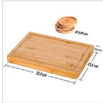
Bemaßung: 2 Fotos