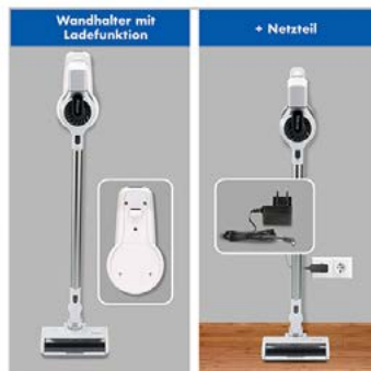
Lieferumfang plus techn. Funktion: 5 Fotos, Bildbearbeitung 1 Produktfoto + Stockfoto