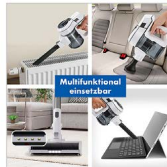
Anwendung: 4 Fotos, 1 Detailfoto, Bildbearbeitung 4 Produktfotos + 4 Stockfotos

ca. 326,00 € ohne Text, ca. 372,00 € mit Text