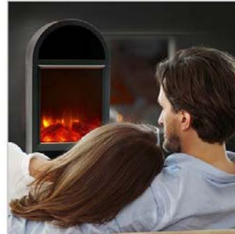
Lifestyle: 1 Foto, Bildbearbeitung Produktfoto + Stockfoto

ca. 68,00 € ohne Text, ca. 80,00 € mit Text