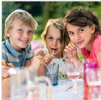
Anwendung: 3 Fotos, Bildbearbeitung 3 x Produktfoto Trinkhalme + Stockfoto

Die zwei Stockfotos sind nicht im Preis enthalten.