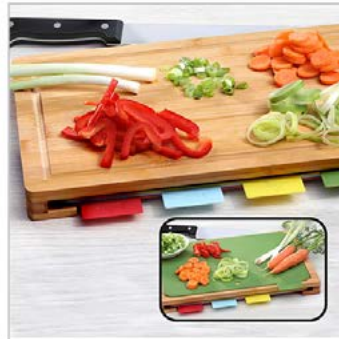
Anwendung: 2 Fotoszenen