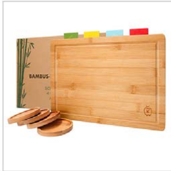
Hauptbild: 2 Fotos