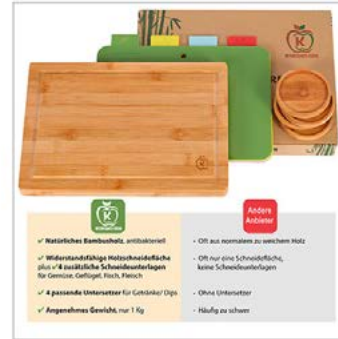
Vergleich Konkurrenz: 1 Foto

ca. 124,00 € ohne Text, ca. 148,00 € mit Text