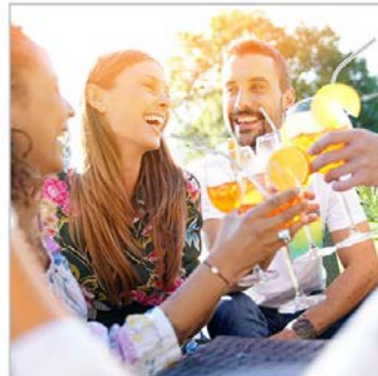
Anwendung: 3 Fotos, Bildbearbeitung 3 x Produktfoto Trinkhalme + Stockfoto