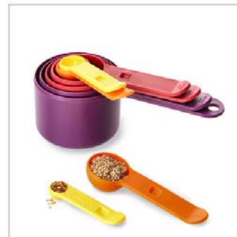
Anwendung: 2 Fotos mit Schatten

ca. 78,00 € ohne Text, ca. 92,00 € mit Text