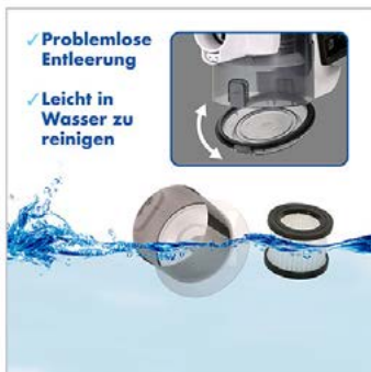
Tech. Funktion: 3 Fotos, Bildbearbeitung 2 Produktfoto + Stockfoto