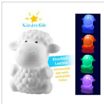
Hauptbild plus techn. Funktion: 5 Fotos