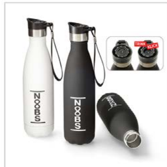
Varianten plus Funktion: 5 Fotos, Schatten