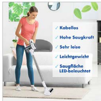
Anwendung: 1 Foto, Bildbearbeitung Produktfoto + Stockfoto