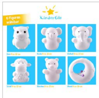
Bemaßung: 6 Fotos