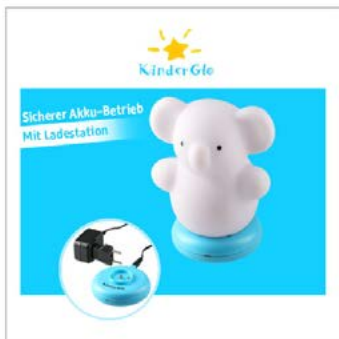
Lieferumfang plus techn. Funktion: 2 Fotos

Die zwei Stockfotos sind nicht im Preis enthalten.