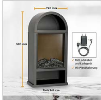
Bemaßung plus Zubehör: 2 Fotos, Bildbearbeitung Produkt + Marmor