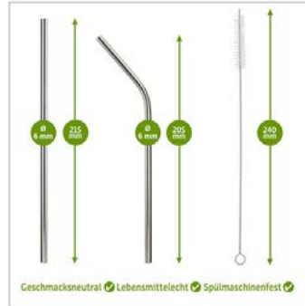
Bemaßung: kein Foto (s. Hauptbild)

ca. 152,00 € ohne Text, ca. 172,00 € mit Text