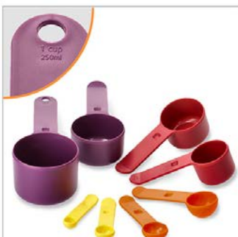
Lieferumfang plus Detail: 2 Fotos, Schatten

ca. 78,00 € ohne Text, ca. 92,00 € mit Text