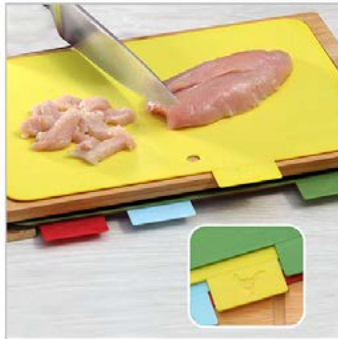
Anwendung: 1 Fotoszene, 1 Detailfoto