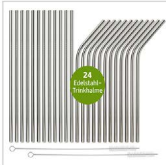
Hauptbild: 3 Fotos