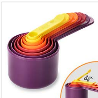
Hauptbild plus Funktion: 2 Fotos mit Schatten