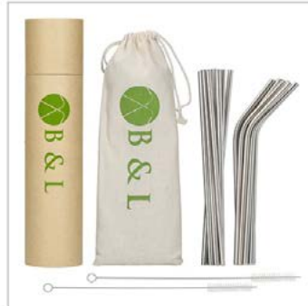
Lieferumfang: 3 Fotos